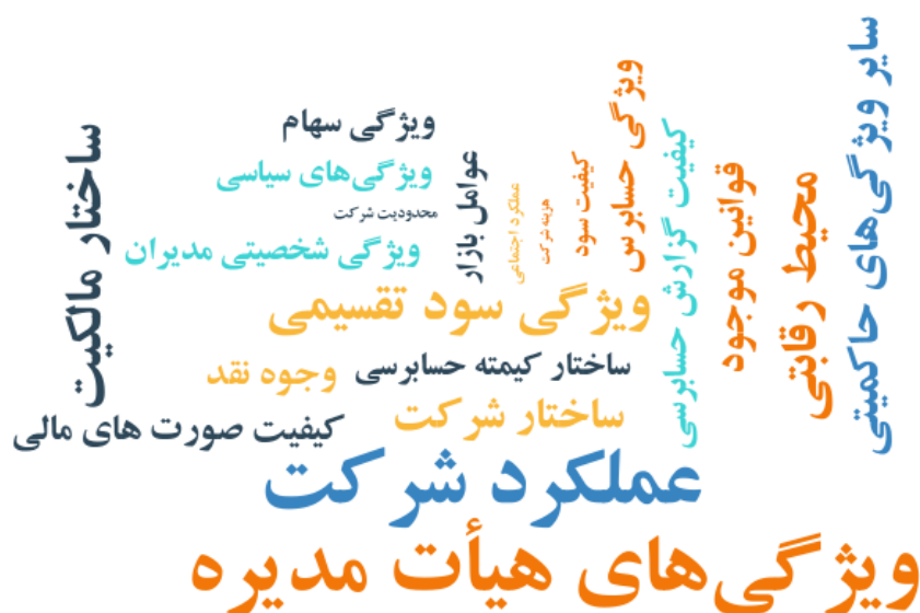
شکل ۲. نمودار ابری مضامین سازمان‌دهنده اجتناب مالیاتی

در نهایت، با اتکا به مضامین سازمان‌دهنده و مضامین فراگیر شناسایی‌شده، الگوی نهایی عوامل مؤثر بر اجتناب مالیاتی طراحی شد. این الگو که در شکل ۳ ارائه شده است، ساختار مفهومی روابط میان ابعاد مختلف اجتناب مالیاتی را در قالب پنج بعد اصلی شامل حاکمیت شرکتی، عوامل محیطی، کیفیت حسابرسی، ویژگی‌های مالی و گزارشگری مالی و عوامل بازار و مرتبط با سهام شرکت نشان می‌دهد. این الگو مبنای ورود به بخش کمی پژوهش و آزمون تجربی روابط میان متغیرها در مراحل بعدی تحقیق قرار می‌گیرد.